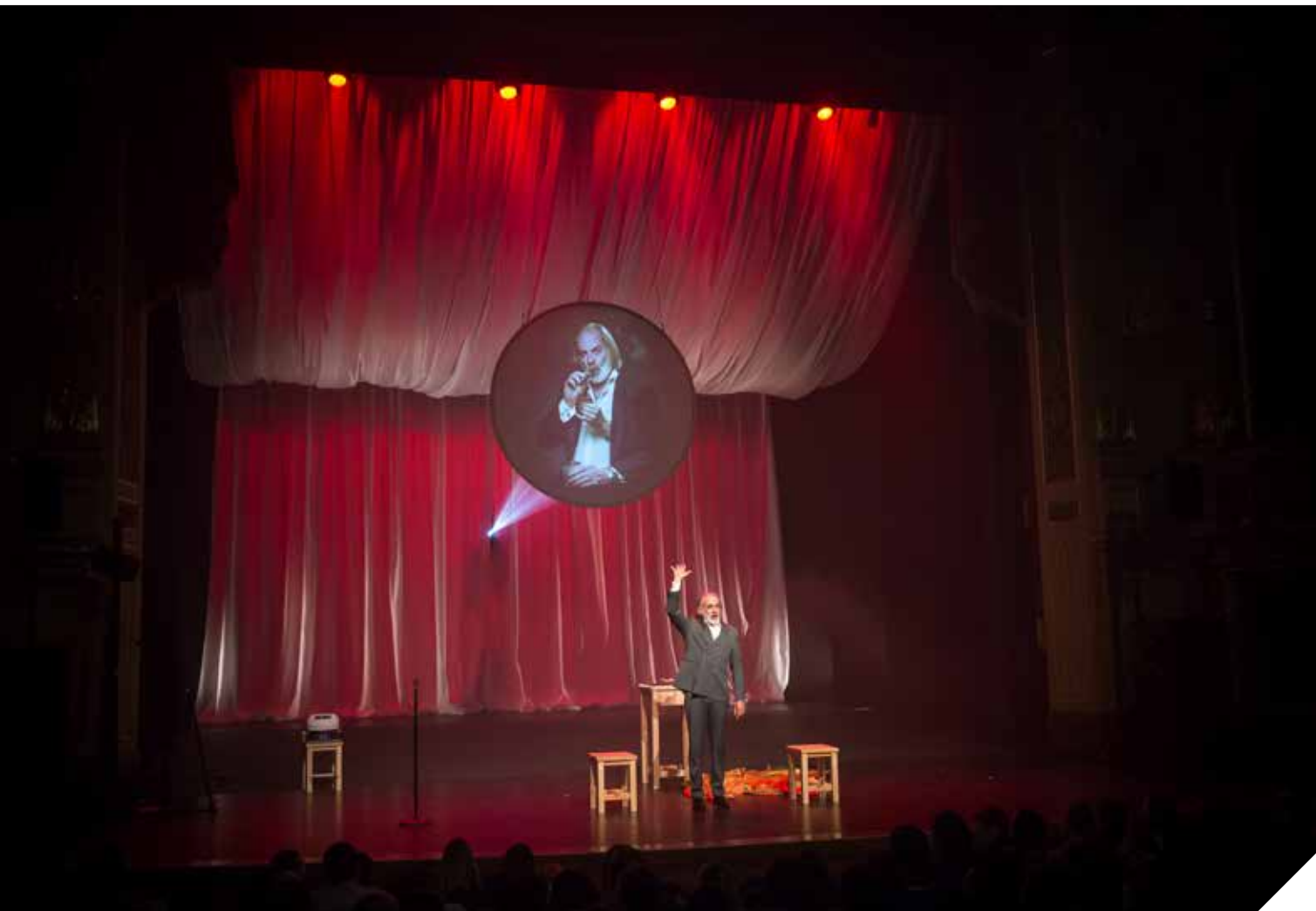
In zijn nieuwe show 'Raar, hé?!' bundelt Gili de beste acts van zijn eerdere shows.