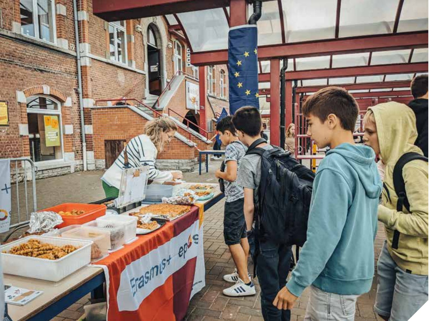
De leerlingen van Don Bosco Halle ontdekken Erasmus op een smakelijke manier tijdens de Erasmus Days.