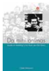
Da mihi animas Prijs: € 15 (excl. verzendkosten)