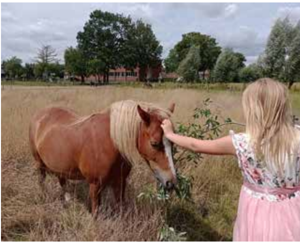
Het schoolondersteunend project De Stormkering biedt onder meer hippotherapie aan.