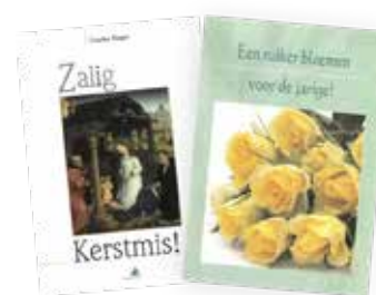
Duopakket: 'Zalig Kerstmis' en 'Een ruiker bloemen voor de jarige' Prijs: € 5 (excl. verzendkosten)