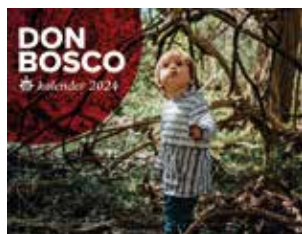
Don Bosco kalender 2024 Prijs: € 5 (excl. verzendkosten)