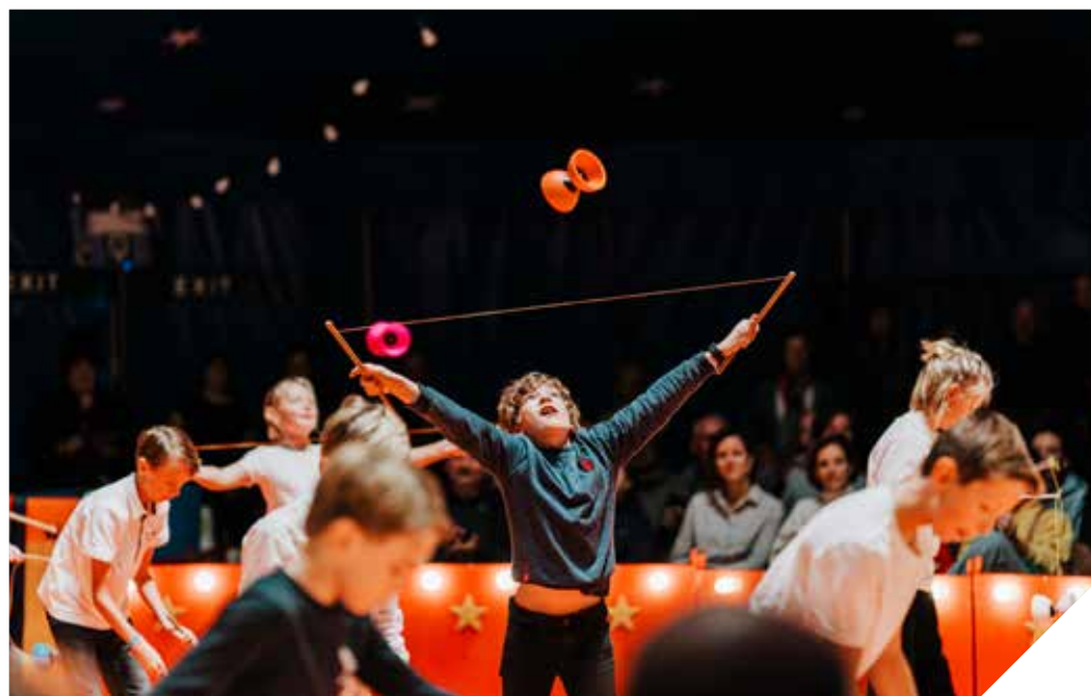
Circus Picolini werkt al 25 jaar samen met scholen: "Het is anders, maar het concept slaat aan."

► “Je hebt de kleuters die hun kunstjes tonen, de oudere leerlingen die hun nieuwe talenten laten zien, een special act van de leerkrachten en tussendoor zijn er ook spectaculaire acts van onze dochters of onszelf. Alles wisselt mooi af zodat de toeschouwers een heus spektakel te zien krijgen.”